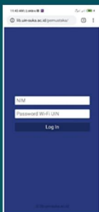
A. GB MENU LOGIN