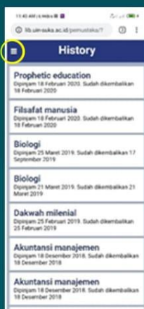
B. GB MENU CEK PINJAMAN